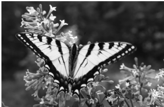
Canadian Tiger Swallowtail (Papilio Canadensis)

There are many beautiful butterflies in our region, including the Canadian Tiger Swallowtail ( Papilio Canadensis ). This butterfly is well-known due to its large wingspan of 53 to 90 mm and its bright yellow colouring with a black tiger-stripe pattern. These striking butterflies can often be sighted in spring on lilacs. The Canadian Tiger Swallowtail has only one generation in a year. A generation includes four stages: adult (butterfly), ovum (egg), larva (caterpillar), and pupa (chrysalis).