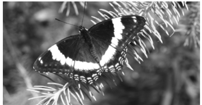
l'Amiral (Limenitis arthemis arthemis)