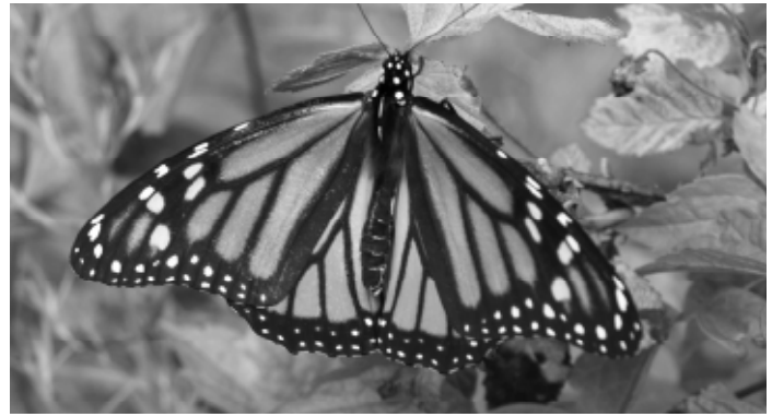
Monarch (Danaus plexippus)

A butterfly that almost everyone can recognize is the Monarch ( Danaus plexippus ). The Monarch is one of the largest butterflies in Canada with a wingspan of 93 to 105 mm. I use to wonder how a butterfly could make the migration to Mexico and back; now I know it is not one butterfly who does the whole journey, but four butterflies. The life cycle of this butterfly is quite interesting.