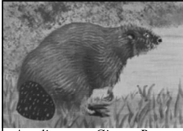
Acrylique par Ginette Bars

Le Castor du Canada ( Castor canadensis ), est le plus gros rongeur de l'Amérique du Nord, il mesure de 3 à 4 pieds, incluant sa queue et pèse entre 35 et 70 livres. Les couples qui se forment, restent unis leur vie durant