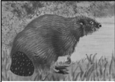
Acrylique par Ginette Bars

by Ginette Bars , translation, Sheila Lord