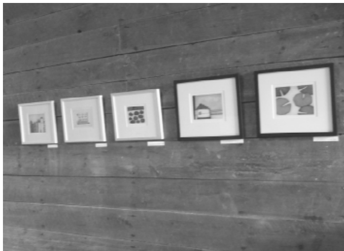
Chez Vergers Philion, Circuit des Arts 2010

En résumé, le comité organisateur du « Circuit des Arts Hemmingford » peut conclure « Mission accomplie » UN GROS MERCI à tous les bénévoles, aux artistes, aux entreprises et aux commanditaires qui ont cru en notre projet.