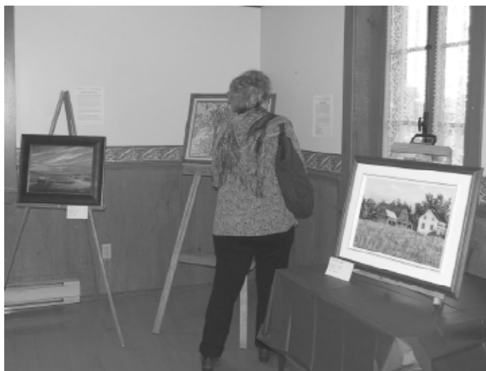
At the Old Convent, Circuit des Arts 2010

A BIG THANK YOU to all the volunteers, artists, businesses and sponsors who believed in our project.