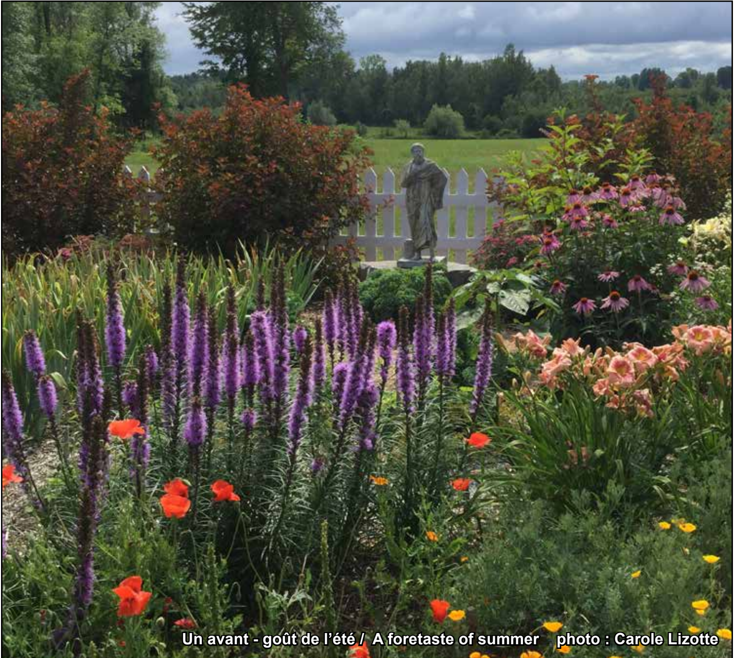
Un avant - goût de l'été / A foretaste of summer

Municipalités Canton & Village de Hemmingford