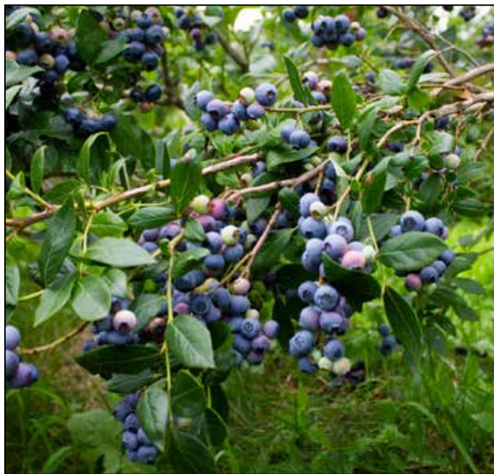
Ferme Giroflée, Hemmingford - fermegiroflee.com