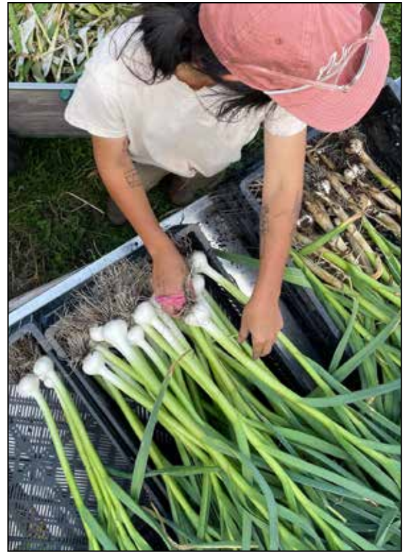
La Fermette, Hemmingford - lafermette.ca

According to the Natural Resource Defense Council in the US: “Multiple meta-analyses comparing thousands of farms nationwide (US) have shown that organic agriculture results in higher stable soil, organic carbon and reduced nitrous oxide (N 2 O) emissions when compared to conventional farming.” : nrdc.org/bio/lena-brook/organic-agriculture-helps-solve-climate-change