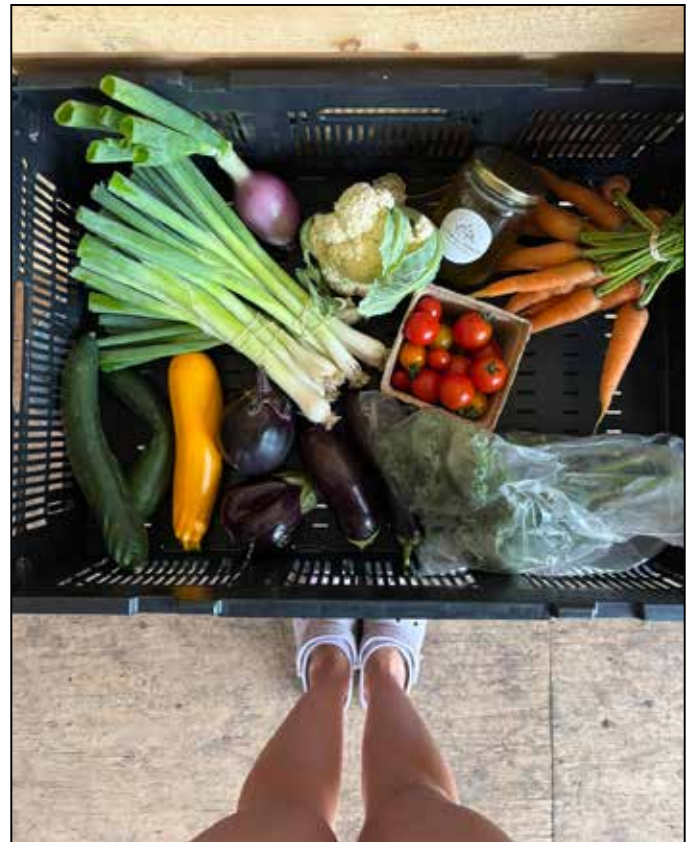
La ferme Perras, Hemmingford - lafermeperras.com

Nous avons la chance d’avoir beaucoup de ces produits dans nos fermes locales à Hemmingford. Consulter la Liste de Produits alimentaires locaux publiée dans l’édition d’avril 2025 du bulletin Info-Hemmingford et utiliser les aliments locaux dans le congélateur “Les Complices Alimentaires” au bureau de poste.